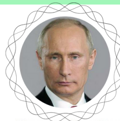
Президент Российской Федерации Владимир Путин